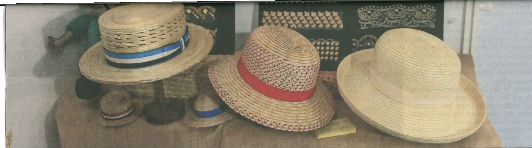
Filigrane Kunstwerke: Hüte und Bordüren der Freiamter Strohindustrie wurden am Stand der Gastregion gezeigt.